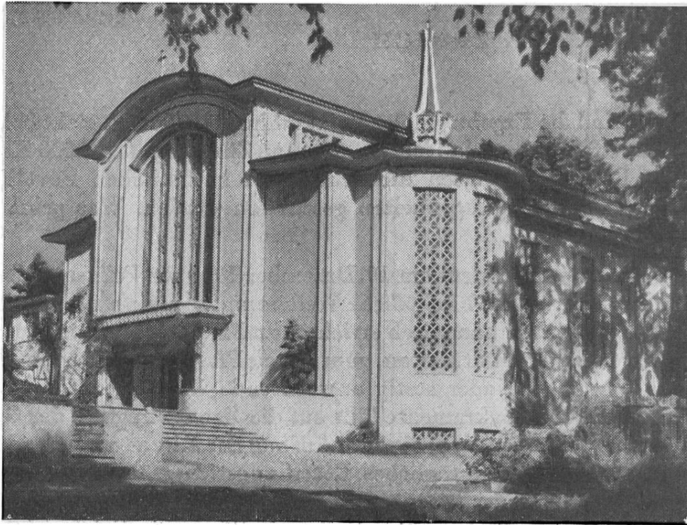
Dreikönigenkirche in Zürich-Enge