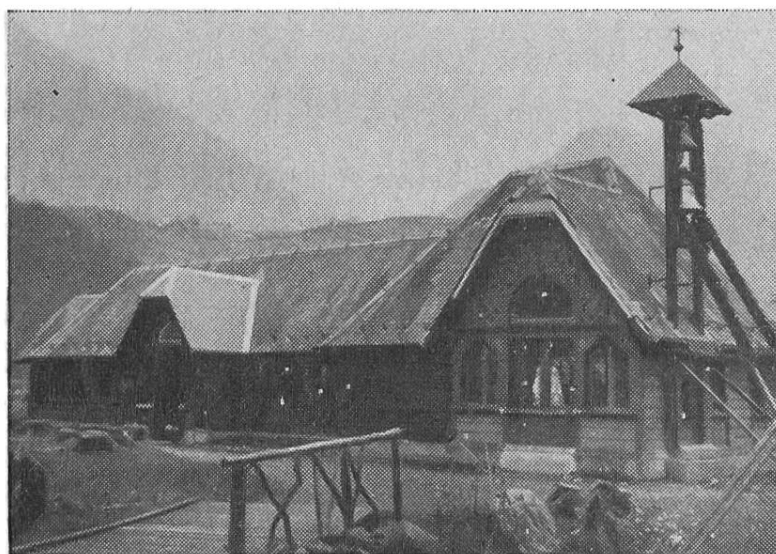
Notkirchlein in Mitlödi