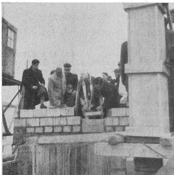
Grundsteinlegung der Kirche in Lausanne-Montoie

Was die Seelsorge betrifft, verdient an erster Stelle Erwähnung die Schaffung von vier neuen religiösen Zentren: Die Pfarr-Rektorate in Lausanne: La Sallaz , Bellevaux und Chailly , wovon die beiden ersten von der Pfarrei Notre-Dame und das dritte von Saint-Rédempteur losgetrennt wurden, und das Pfarr-Rektorat Aubonne-Bière , zusammengefügt von schon seit 1917 und 1929 bestehenden Gottesdienststationen. Bisher von den Pfarreien Morges und Rolle besorgt, wohnt nun ein Pfarr-Rektor in Aubonne . Infolge der grossen Entwicklung wurden ferner sowohl für Lausanne-Montoie als auch für Moudon neue Vikariate geschaffen. Moudon, eine weitausgedehnte