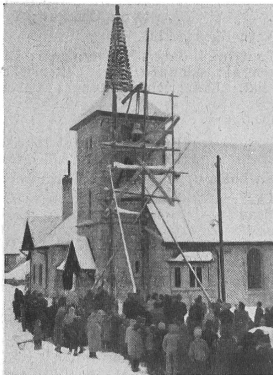
Glockenaufzug in Cernier

Infolge dieser Zunahme der katholischen Bevölkerung sind da und dort die Kirchen zu klein geworden. Für den Augenblick begnügt man sich mit vermehrten Gottesdiensten. In Le Locle aber liess sich die Erweiterung der Kirche nicht mehr aufschieben. Peseux (bei Neuenburg) steht vor dem Beginn eines Kirchenbaues, nachdem die Platzfrage eine Lösung gefunden. In diesen beiden Fällen darf dank der seit Jahren geäußerten, leider noch ungenügenden Fonds auf baldige Verwirklichung der Bauvorhaben gedacht werden. Die Pfarreien von St-Blaise und von Cernier feierten am 3. März, resp. am 17. Dezember die Weihe der Glocken, die nun Sonntag für Sonntag die Gläubigen zum Gottesdienst rufen werden.