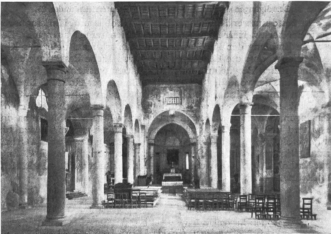
In der altherwürdigen Kirche San Francesco feiern die deutschsprechenden Katholiken von Locarno ihren Gottesdienst