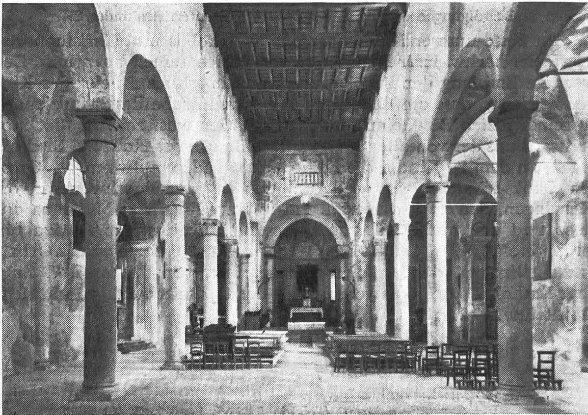
In der altherwürdigen Kirche San Francesco feiern die deutschsprechenden Katholiken von Locarno ihren Gottesdienst