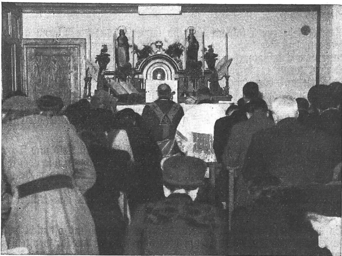
Erstes hl. Meßopfer in Niederbipp

Diese Bitte an viele Diasporapfarreien sei auch hier ausgesprochen: Entlastet die Inländische Mission, wie dies in den Städten Basel, Zürich und anderswo längst geschehen ist. Dadurch kann wieder anderen neuen, noch ärmeren Stationen geholfen werden.