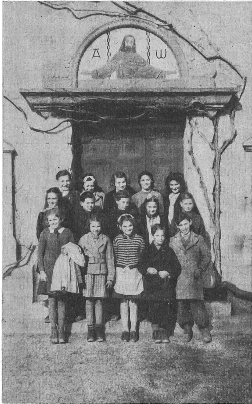
Mülhauserkinder nach dem katholischen Unterricht in der protestantischen Kirche zu Hindelbank

Die Diasporakirche erweiterte sich um 3 neue Pfarrovikariate. Zu Anfang Oktober erhielt H ir z e l (Kt. Zürich) einen eigenen Seelsorger, dem einstweilen ein Bauer zwei Zimmer für Hauskapelle und Wohnung zur Verfügung stellte. Kurz zuvor konnte in N i e d e r h a s l i