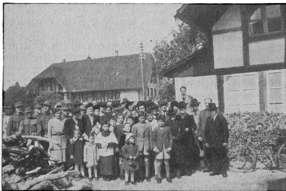
Kathol. Gottesdienst- Besucher in Lyß

dem Leid die Seelennot der Glaubensbrüder keineswegs. Im Gegenteil, sie haben auch hier ihre Gaben gemehrt. Erreichte doch die o r d e n t l i c h e S a m m l u n g für unser Missionswerk im vergangenen Jahre eine Höhe wie noch in keinem Jahr zuvor, nämlich die Summe von Fr. 405 186.53 (anno 1943 Fr. 377,976.49). Das ist eine Glanzleistung zu einer Zeit, wo alles so teuer geworden und wo kein Tag vergeht, an dem nicht ein Sammler vor der Türe steht oder die Post gleich mehrere Bettelbriefe auf den Tisch legt. Unser Volk will seine Seelenhirten in der Diaspora nicht hungern lassen, sie sind ohnehin recht bescheiden besoldet. Aber die ärmliche Besoldung samt Verwaltung der Inländischen Mission erforderte doch die gewaltige Summe von Fr. 487 121.01 an ordentlichen Ausgaben, so daß immerhin noch ein Defizit von Fr. 81 934.48 entsteht. Glücklicherweise haben die außerordentlichen Vergabungen und Legate im Betrage von Fr. 128 060.05 diesen Ausfall gedeckt, obwohl Fr. 35,550 noch mit Nutznießung belastet und deshalb noch nicht verwendbar waren.