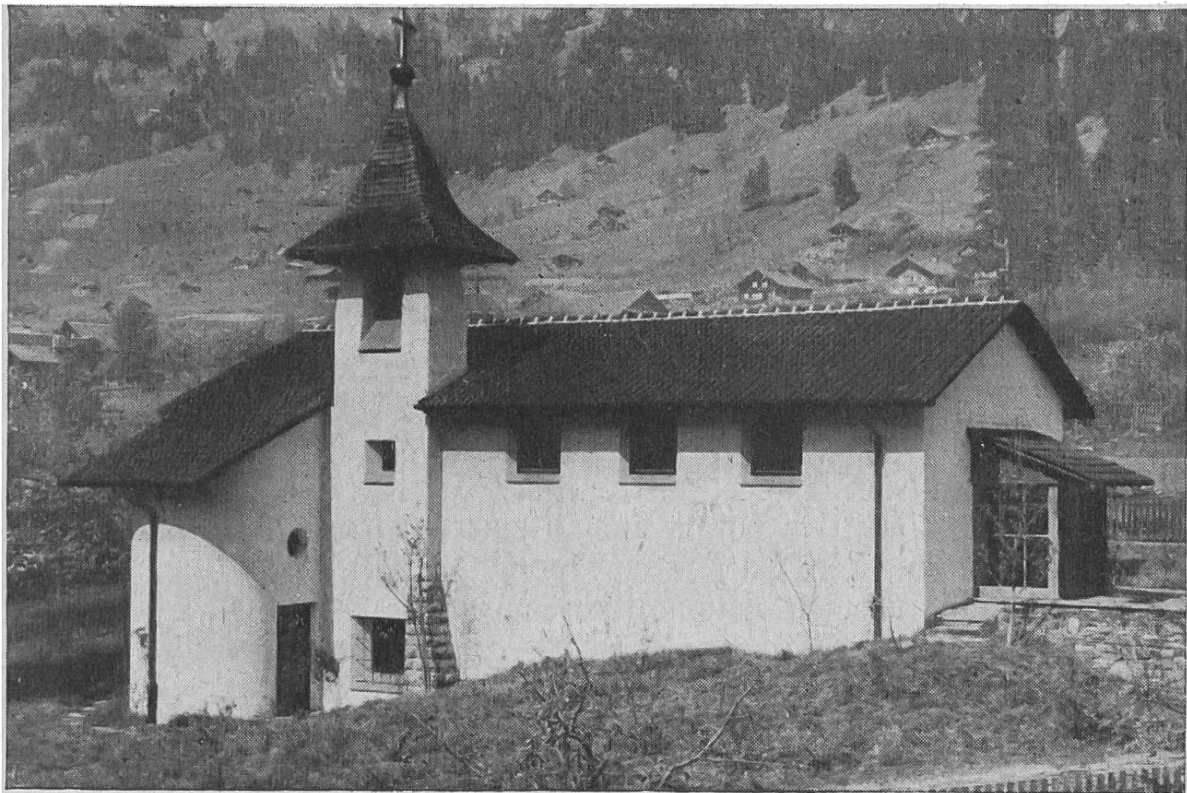
St. Mauritiuskapelle in Frutigen