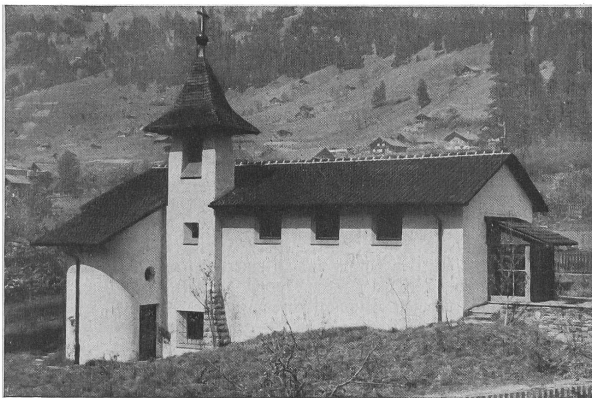
St. Mauritiuskapelle in Frutigen