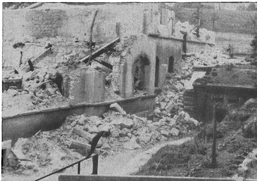
Kathol. Pfarr- und Vereinshaus Schaffhausen nach dem 1. April 1944

an denen Jahrhunderte gebaut und in denen unzählige Generationen gebetet und sich geheiligt haben.