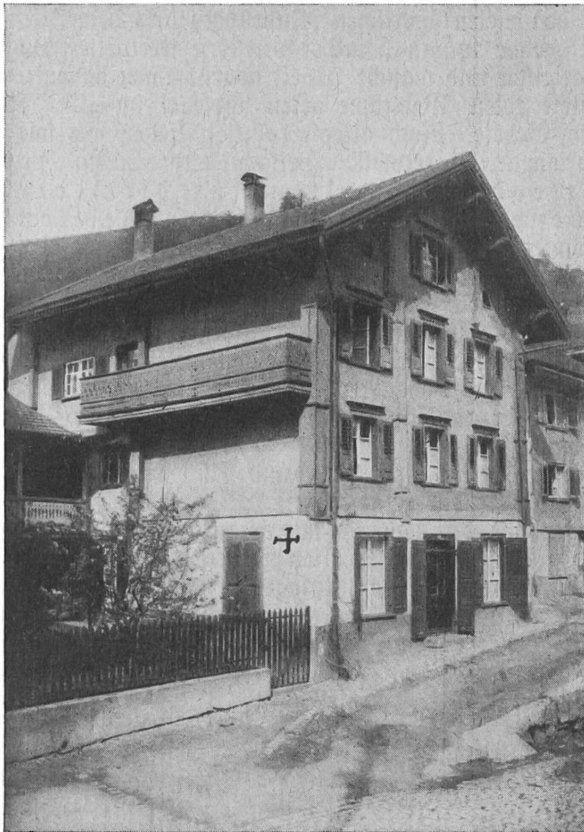
Missionshaus und Kapelle in Schiers

daß die junge Diasporakirche vielfach aus den sauerverdienten Bagen kleiner und sparsamer Leute erhalten wird. Und gerade auf diesen Gaben ruht ein besonderer Segen Gottes.