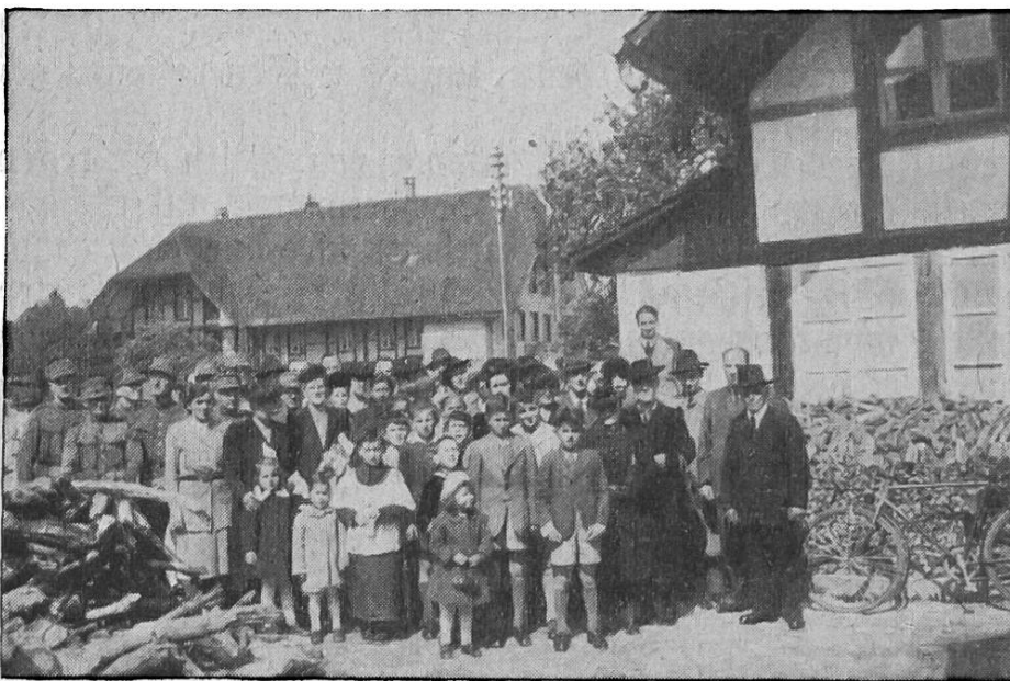
Kathol. Gottesdienst- Besucher in Lyß

dem Leid die Seelennot der Glaubensbrüder keineswegs. Im Gegenteil, sie haben auch hier ihre Gaben gemehrt. Erreichte doch die ordentliche Sammlung für unser Missionswerk im vergangenen Jahre eine Höhe wie noch in keinem Jahr zuvor, nämlich die Summe von Fr. 405 186.53 (anno 1943 Fr. 377,976.49). Das ist eine Glanzleistung zu einer Zeit, wo alles so teuer geworden und wo kein Tag vergeht, an dem nicht ein Sammler vor der Türe steht oder die Post gleich mehrere Bettelbriefe auf den Tisch legt. Unser Volk will seine Seelenhirten in der Diaspora nicht hungern lassen, sie sind ohnehin recht bescheiden besoldet. Aber die ärmliche Besoldung samt Verwaltung der Inländischen Mission erforderte doch die gewaltige Summe von Fr. 487 121.01 an ordentlichen Ausgaben, so daß immerhin noch ein Defizit von Fr. 81 934.48 entsteht. Glücklicherweise haben die außerordentlichen Vergabungen und Legate im Betrage von Fr. 128 060.05 diesen Ausfall gedeckt, obwohl Fr. 35,550 noch mit Nutznießung belastet und deshalb noch nicht verwendbar waren.