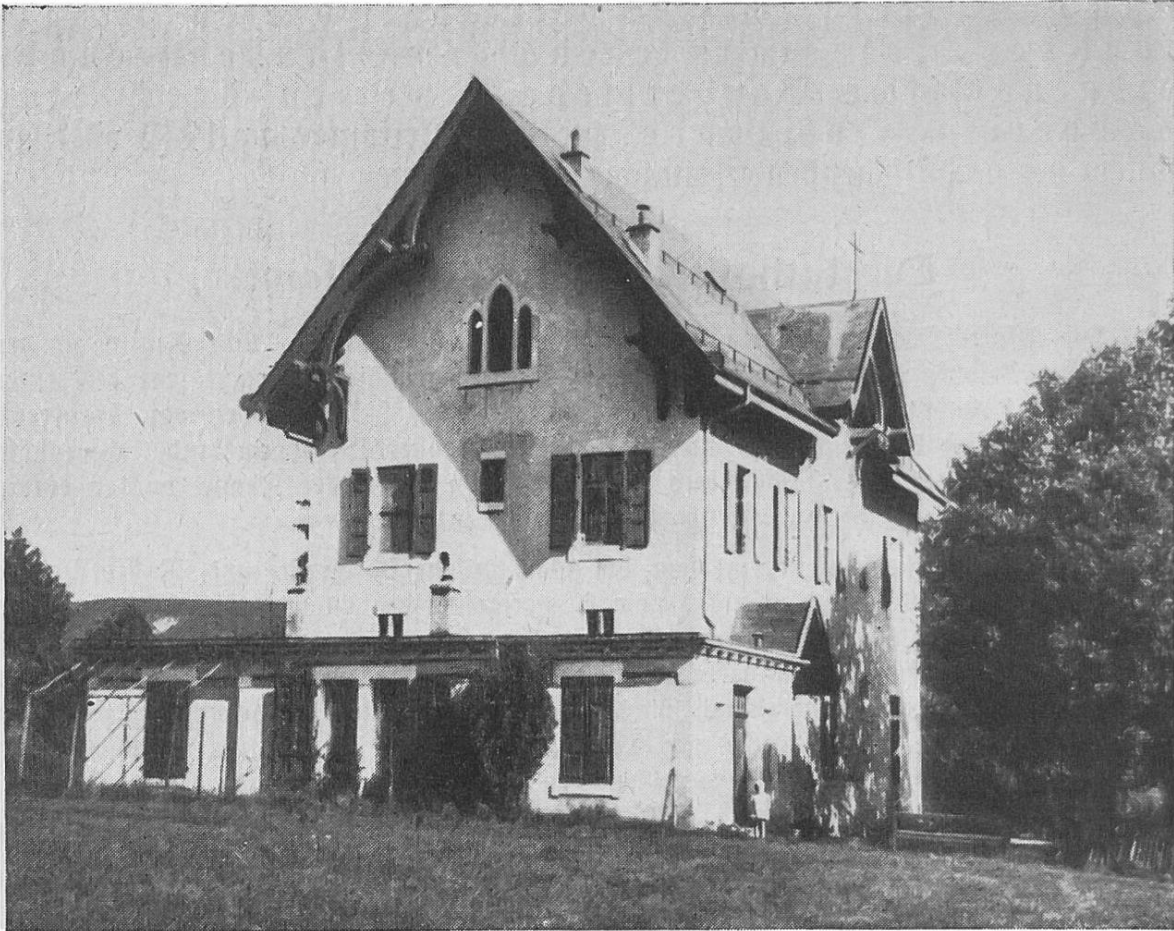
Pfarrgemeindehaus von La Plaine