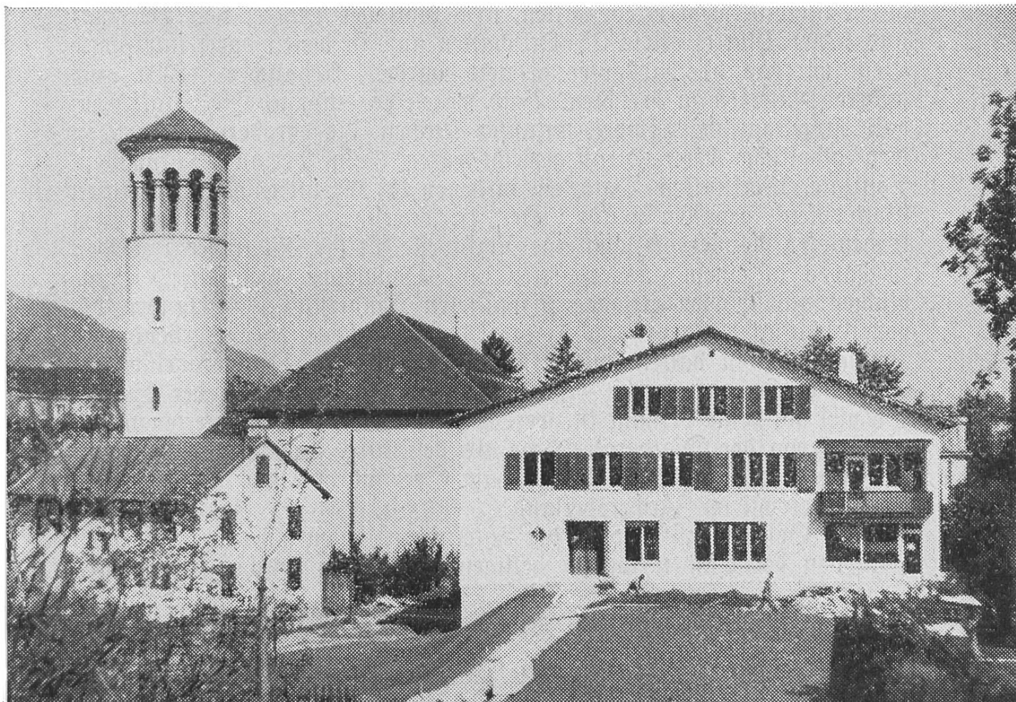
Pfarrhaus bei der St. Franziskuskirche in Zürich

Unverzagt schaut die Diasporaseelsorge auch in die Zukunft. In Brienz wurde an einem bodenständigen Liebfrauenkirchlein gebaut, während man für den Pfarrer von Meiringen anstatt der Mietwohnung ein eigenes Pfarrhaus plante und begann. In der Westschweiz wurde für die dringend notwendige Pfarrkirche von Peseux ein günstig gelegener Bauplatz erworben; ebenso kauften die Katholiken von Les Verrières den Platz für den Bau einer Kapelle. Die Pfarrei Sainte-Clotilde in Genf baut an einer Kapelle im Quartier Queue-d'Arve. Saint-François in der gleichen Stadt erwarb ein Haus im Quartier Accacias und baut dessen Erdgeschoß zur Notkapelle aus, während außer der Stadt die junge Pfarrei Pregny-Chambésy durch den Umbau eines Hauses Pfarrwohnung und Vereinsäle bekommt.