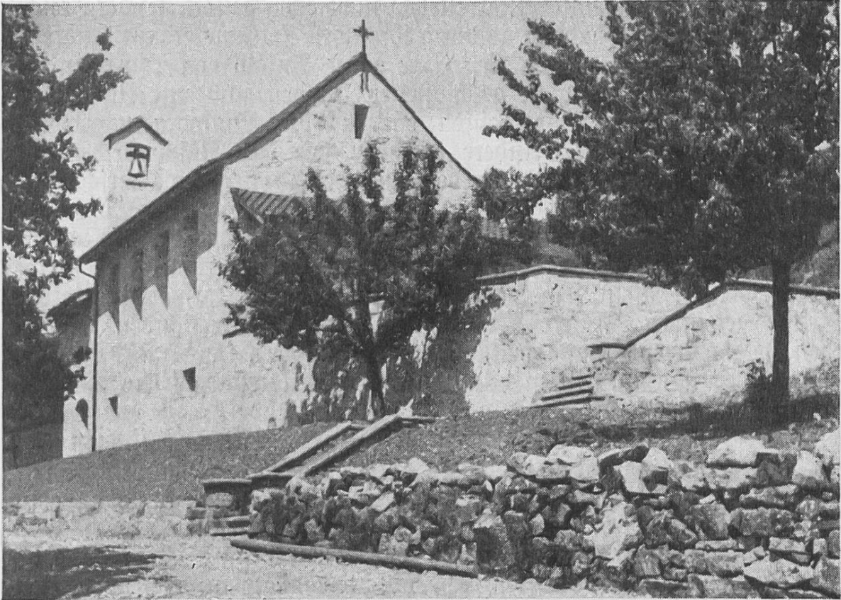
Grenzkirchlein von Schleitheim in schlichtem Heimatstil

Generalversammlung der Jungfrauenkongregation konnte ich bemerken, daß zwei Kongreganistinnen seit Gründung unserer Pfarrei, also seit zwei Jahren und vier Monaten, täglich nie nach Z. (eine Bahnfahrt von beinahe einer Stunde) zur Arbeit gefahren sind, ohne nicht erst um 6 Uhr hier die hl. Kommunion empfangen zu haben. Eine andere So- dalin geht jeden Morgen vor ihrem Gang zur Arbeit in hier um 6.30 erst zur hl. Kommunion. Kein Tag ohne sie!"