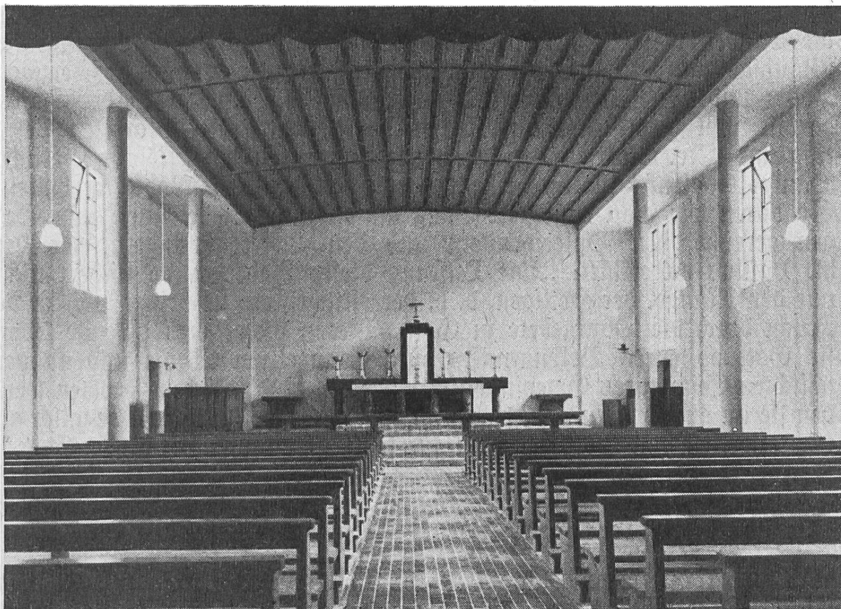
Innenansicht der neuen Heilig Geistkirche in Zürich-Höngg

Eine schöne und wertvolle Hilfe für die Diasporaseelsorge sind immer auch Jahrzeitstiftungen , die bei der Inländischen Mission gemacht werden. Die gestifteten hl. Messen werden jeweils einer armen Diasporakirche zugewendet, die alljährlich über das Messstipendium hinaus auch den kleinen Mehrzins als willkommene Gabe buchen kann. Im vergangenen Jahre wurden insgesamt mit einem Kapital von Fr. 8250.- für 51 hl. Messen 17 Stiftungen gemacht, die von den