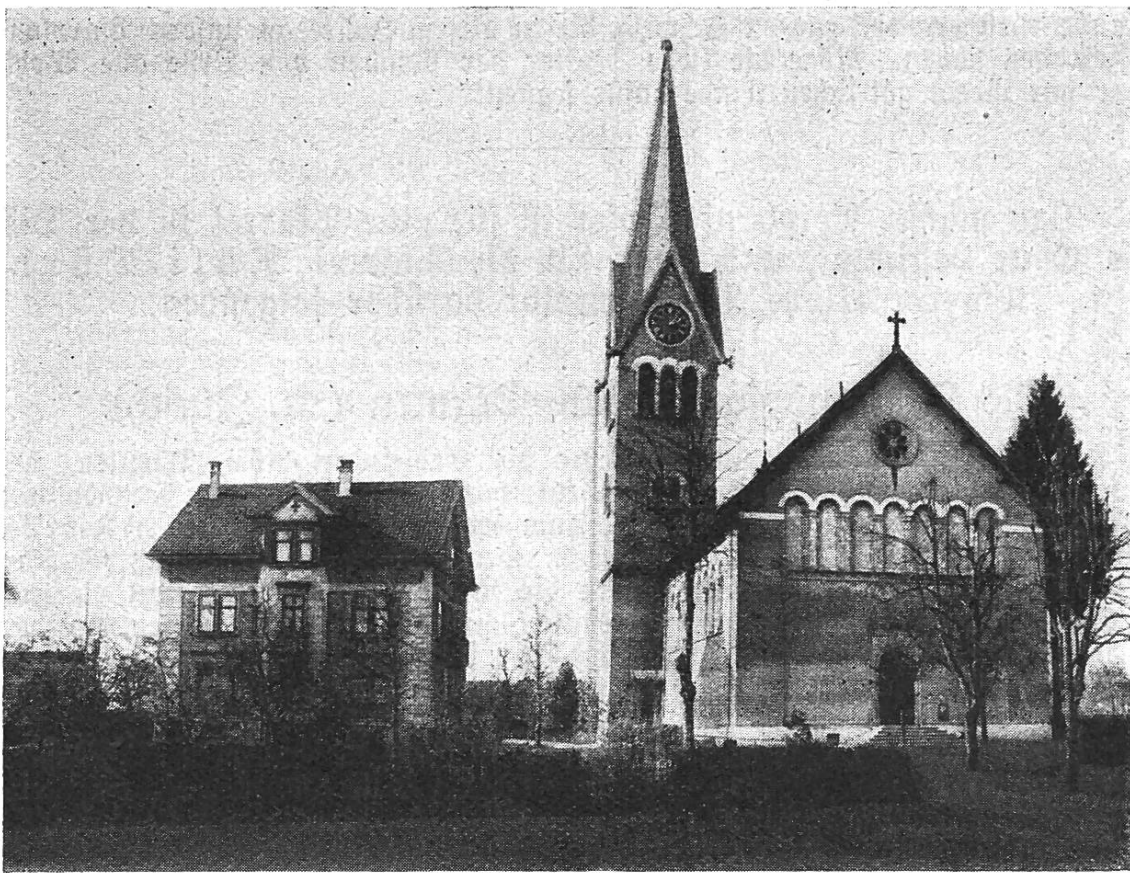
Kathol. Kirche und Pfarrhaus in Rüti-Dürnten (Kt. Zürich).