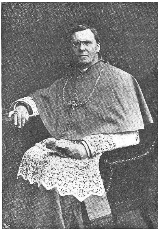
Msgr. A. Bovet sel. Bischof von Freiburg.

Eine segensvolle Neuordnung brachte das Berichtsjahr der Diaspora des Waadtlandes. Schon auf seiner ersten Synode 1912 brachte der unvergeßliche Bischof Msgr. Bovet sel. die dortigen Pastoralverhältnisse zur Sprache. Eine neue kirchliche Einteilung war notwendig. Das war in der großen Waadt mit ihren wenigen katholischen Pfarreien keine leichte Sache. Der apostolische Eifer des klugen Bischofs überwand aber alle Hindernisse. Am 11. Januar 1915 erschien der bischöfliche Erlaß über die Neueinteilung. Die bisherigen Diaspora-Pfarreien wurden neu umschrieben. Die 6 alten Waadtländerpfarreien erhielten zu ihrem kathol. Bestande noch ein schönes Stück Diaspora. Und die Seelenliebe des guten Hirten schritt auch über die Kantonsmarken hinweg. Manche Grenzpfarrei von Freiburg bekam zu ihrem uralten Kirchensprengel ungewohntes Neuland für die Seelsorge drüben in dem weiten Gebiete der Waadt. Gott lohne nun im Himmel dem guten, leider so früh verstorbenen Oberhirten, diese seine große Sorge für die Diaspora-Katholiken. Unsere dankbare Anerkennung aber auch den eifrigen Pfarrern von Freiburg, die zu ihren bisherigen Mühen nun auch Diasporasorgen opfer-