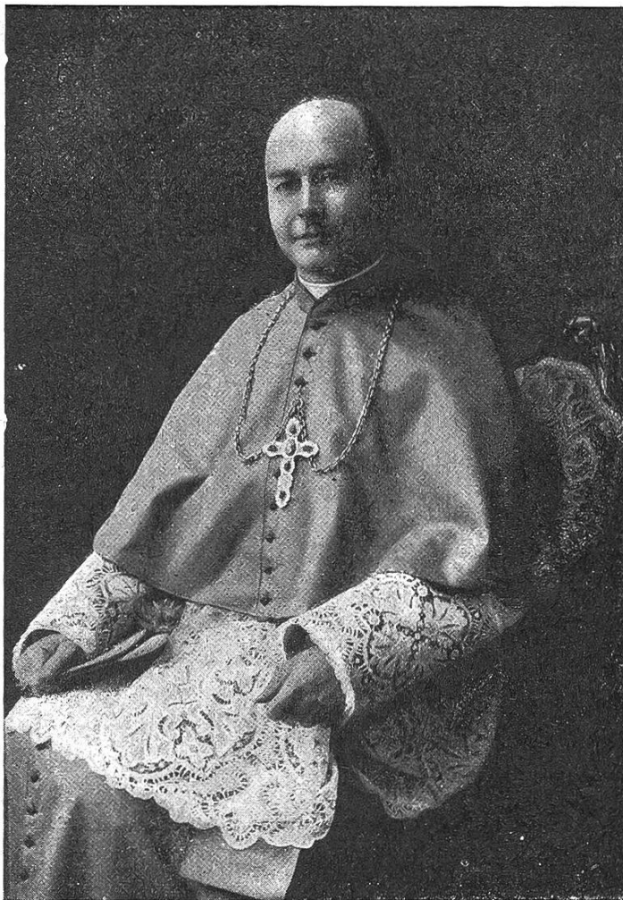
Msgr. Placidus Colliard Bischof von Lausanne-Genf.

Das Jahr 1915 brachte dem Schweizerbauer eine gesegnete Ernte mit gutem Absatz. Dankbar erhöhte da der katholische Landmann sein