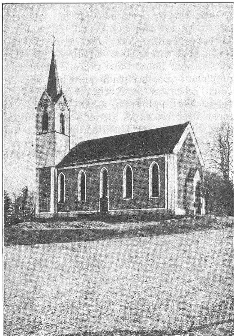
Katholische Kirche in Herisau.

So blieb es Jahrhunderte lang. Nachdem aber das freie Niederlassungsrecht in der Schweiz gewährleistet, ließen sich auch in Herisau und Umgebung wieder Katholiken nieder, welche zum Besuche des Gottesdienstes auf Gossau oder Bruggen angewiesen waren. Dieser Umstand führte viele Schwierigkeiten mit sich z. B. bei Taufen, Beerdigungen, Unterrichtsbesuch der Kinder u. s. w.; so daß sich der allgemeine Wunsch nach einem eigenen Gottesdienst kundgab. Dieser