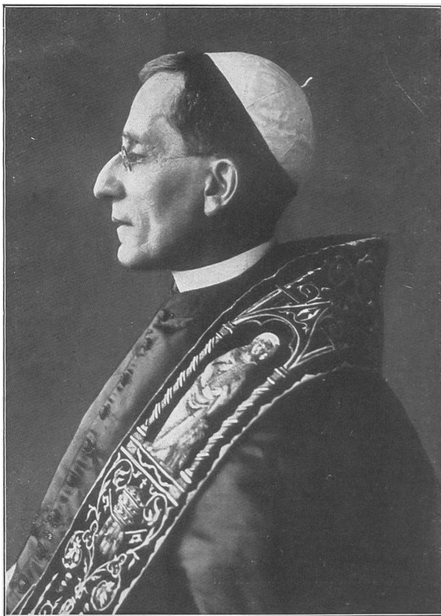
Unser Hl. Vater Papst Benedikt XV.