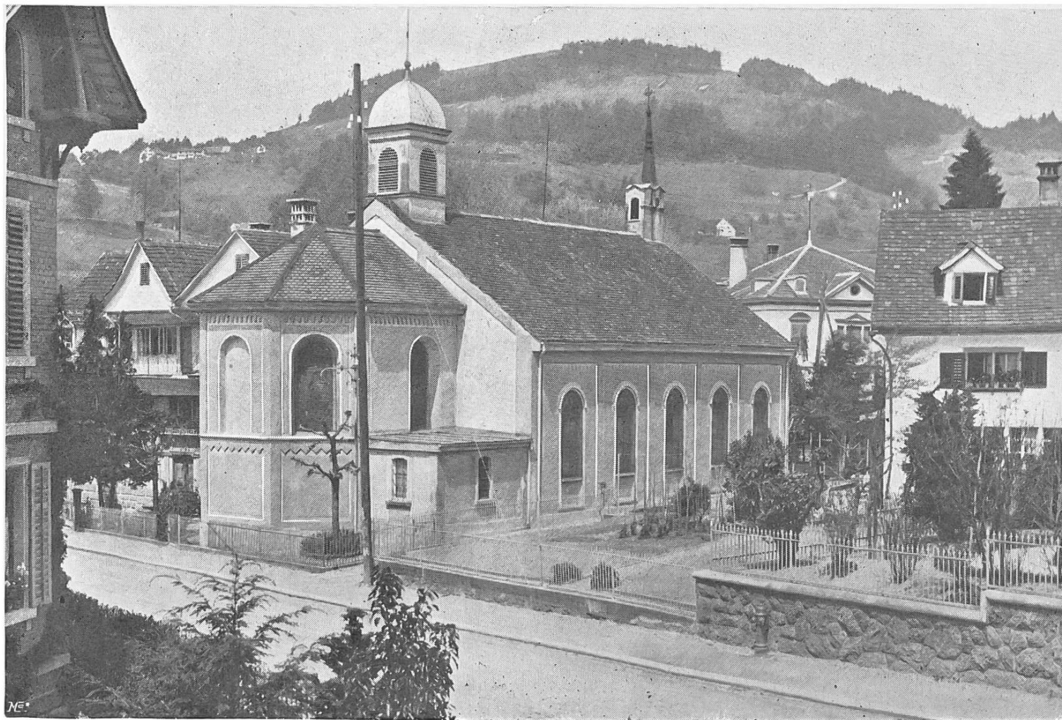
Katholische Kirche in Wald (Kanton Zürich).