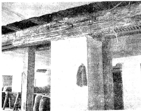
Abbildung Nr. 2. Geöffnete Stoßfuge über dem Pfeiler.