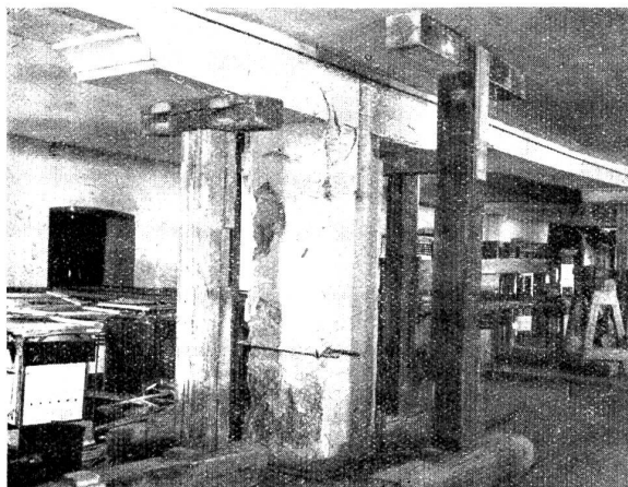
Abbildung Nr. 3.

Schadhafter Pfeiler im III. Stock, äußerlich wahrnehmbare Brucherscheinungen an Unterzug und Sattelhölzern.