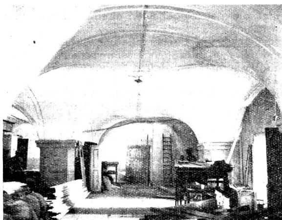
Abbildung Nr. 1. Gewölbte Decke des Erdgeschosses.