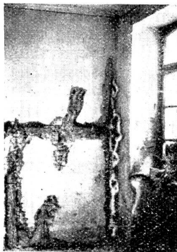
Abb. 30. Schüttsteinnische mit Fruchtkörperbildung.

usw. Auch kommt es vor, daß die Ansteckung verursacht wird vom Durchwachsen der Mycel-Stränge (Abb. 16) durch das Mauerwerk vom Nachbarhaus her. Die wichtigste Ansteckungsgefahr bedeuten aber Hausschwammherde mit reifen Fruchtkörpern (Abb. 30), die nicht beseitigt werden, durch die außerordentliche Sporenerzeugung und -verbreitung. Diese keimen allerdings nur unter geeigneten Wachstumsver-