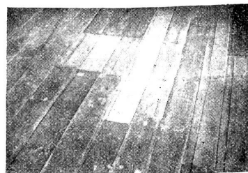
Abb. 14. Reparierter Fußbodenbelag.

Jeder, der beruflich irgend etwas mit Häusern zu tun hat, ob direkt oder indirekt, der Baufachmann, wie Architekt, Bauunternehmer, Zimmermann, Schreiner, Holzlieferanten usw. Weiterhin der Hausbesitzer selbst, der auf die Erhaltung seiner Gebäude Bedacht hat. Auch der Mieter darf diesen Dingen nicht teilnahmslos gegenüberstehen, weil er den Eigentümer rechtzeitig auf etwaige Bildungen aufmerksam