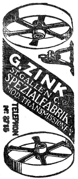
RIEMEN - SCHEIBEN in Holz, Guss und Eisen. 5807 Transmissionen und Lederriemen.