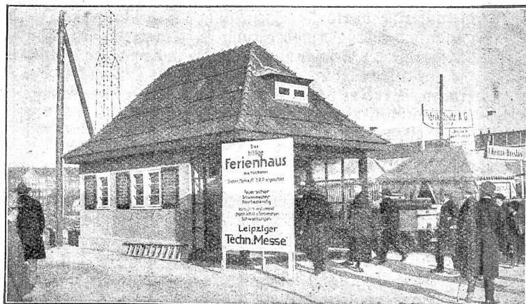
Ausgestelltes Ferienhaus an der Technischen Messe.

den Bund angenommen. In einem Kreisschreiben an die Kantonsregierungen veranstaltet nun das eidgenössische Volkswirtschaftsdepartement eine Rundfrage über die bisherige Ordnung der Berufsberatung und Lehrlingsfürsorge, über die Aufwendungen für diesen Zweck und die Ergebnisse, ferner über Vorschläge für die im Postulat dem Bunde zugebadhte Beteiligung. Die Antworten sollen bis zum 31. Dezember dieses Jahres der Abteilung für Industrie und Gewerbe eingesandt werden.