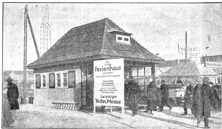
Ausgestelltes Ferienhaus an der Technischen Messe.

den Bund angenommen. In einem Kreisschreiben an die Kantonsregierungen veranstaltet nun das eidgenössische Volkswirtschaftsdepartement eine Rundfrage über die bisherige Ordnung der Berufsberatung und Lehrlingsfürsorge, über die Aufwendungen für diesen Zweck und die Ergebnisse, ferner über Vorschläge für die im Postulat dem Bunde zugebachtete Beteiligung. Die Antworten sollen bis zum 31. Dezember dieses Jahres der Abteilung für Industrie und Gewerbe eingesandt werden.