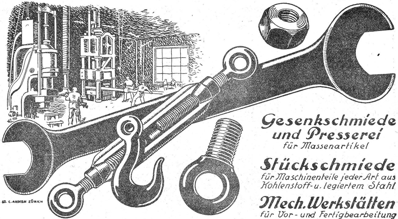
St. C. ARNEM ZÜRICH

Gesenkschmiede und Presserei für Massenartikel