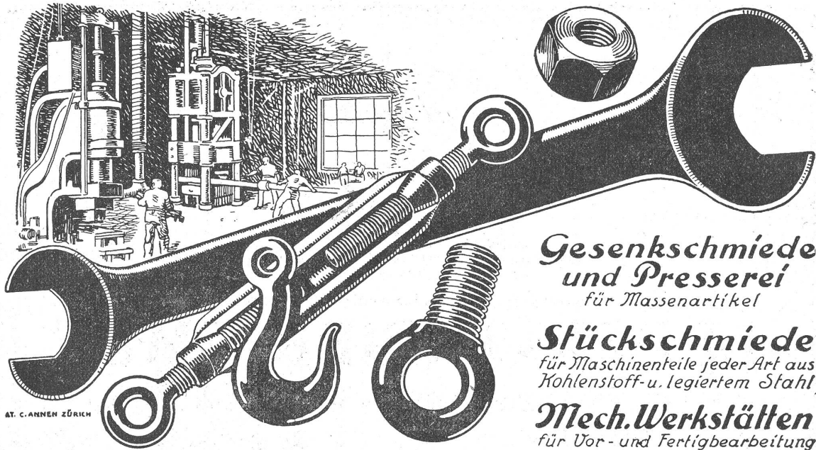
AT. C. ANHEN ZÜRICH

Gesenkschmiede und Presserei für Massenartikel