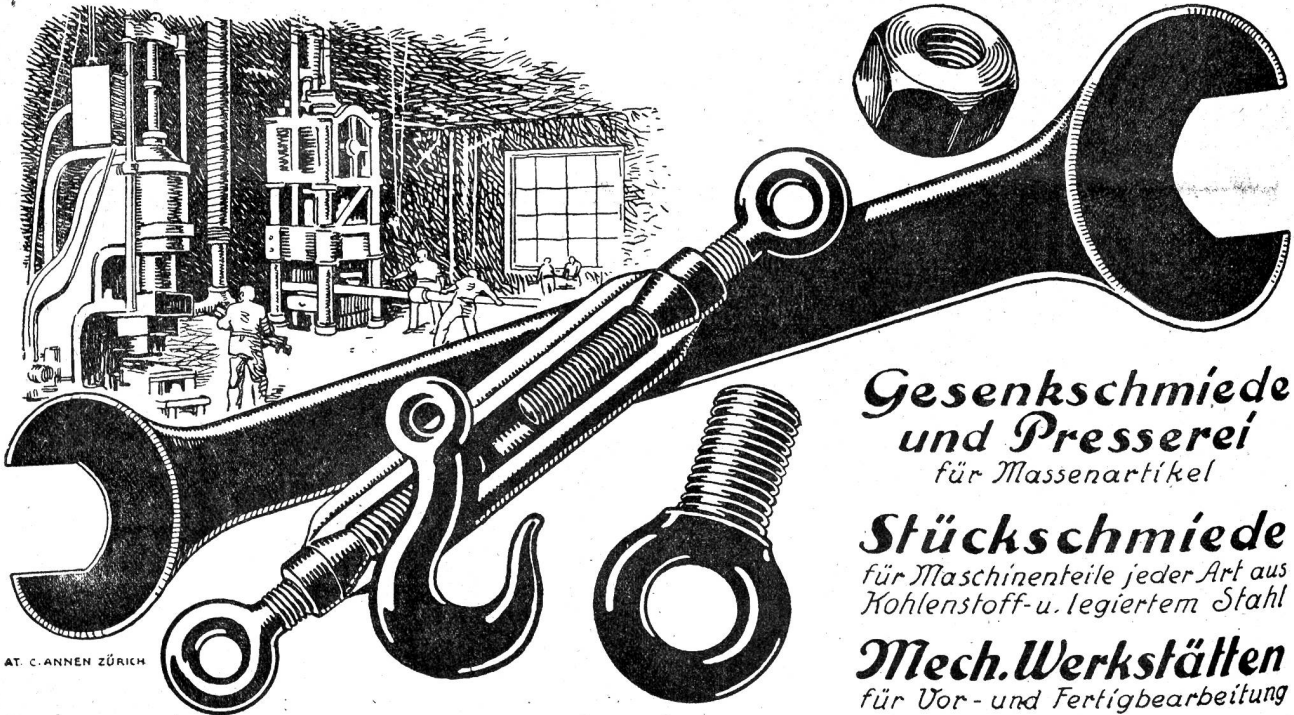
AT. C. ANNEN ZÜRICH

Gesenkschmiede und Presserei für Massenartikel