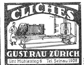
GUSTRAU ZÜRICH Uri Mühlesteg 6 Tel. Seinau 1908