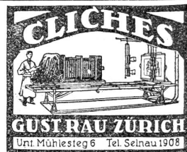
GUST RAU ZÜRICH Unt. Mühlesteg 6 Tel. Seinau 1908