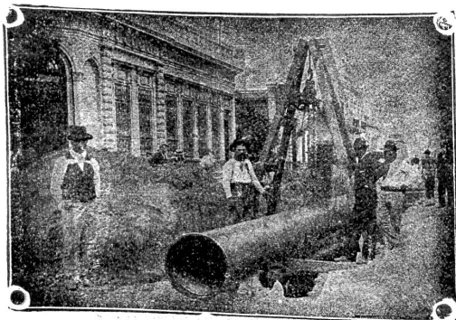
Verlegung überlapptgeschweisster Muffenrohre für die Wasserleitung von La Plata (Argentinien)