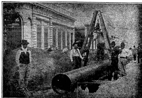
Verlegung überlapptgeschweisster Muffenrohre für die Wasserleitung von La Plata (Argentinien)