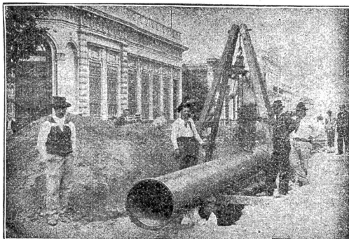
Verlegung überlapptgeschweisster Muffenrohre für die Wasserleitung von La Plata (Argentinien)