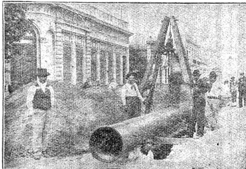
Verlegung überlapptgeschweisster Muffenrohre für die Wasserleitung von La Plata (Argentinien)