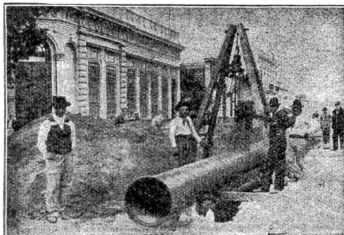
Verlegung überlapptgeschweisster Muffenrohre für die Wasserleitung von La Plata (Argentinien)