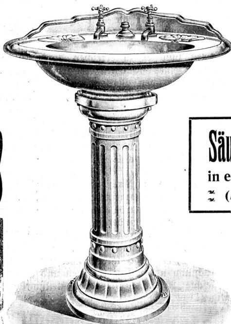
Säulen - Waschtische in englischem Fayence ~ (Marke Cauldon). ~