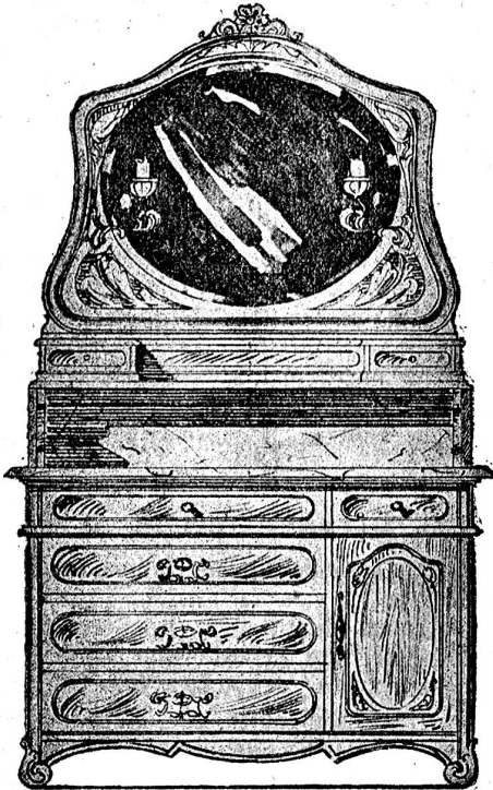
Washkommode mod. Louis XV.