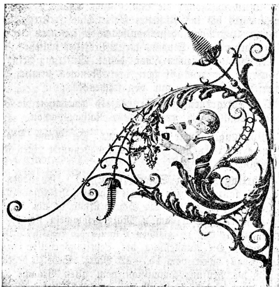
Entworfen und ausgeführt von Fr. Zwinggi, Kunstschlosserei, Zürich.