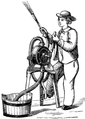
Flügelpumpe auf Bock.