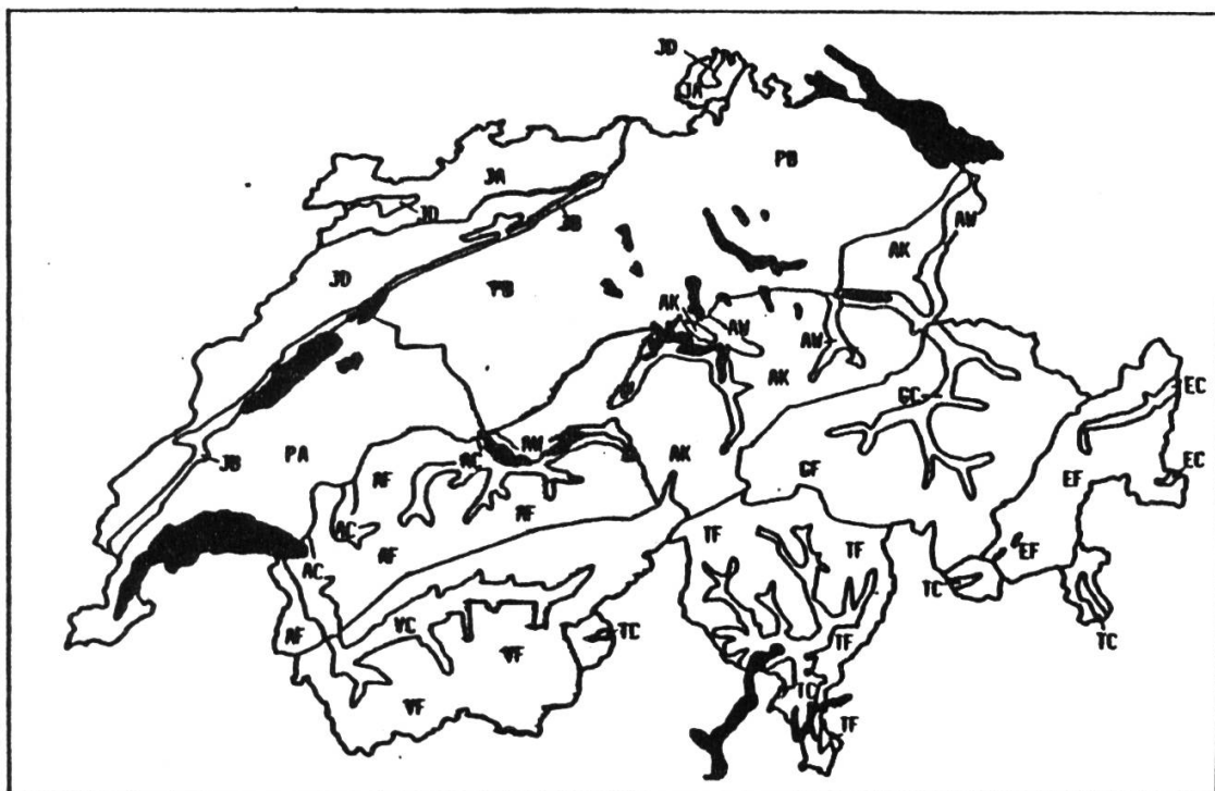
FIGURE 1. LES REGIONS FAUNISTIQUES DE SUISSE

thermiques de la Suisse" (SCHREIBER, 1977), nous a amené à remanier quelque peu les régions zoogéographiques proposées antérieurement. Excellente par principe, la carte de SAUTER présente le défaut de ne pas déterminer précisément la limite séparant les régions de vallées (chaudes) de celles de montagne (froides). Or, la publication des niveaux thermiques de la Suisse à l'échelle de 1:200'000 permet de fixer très précisément une telle limite. Ces considérations nous conduisent à proposer une nouvelle carte qui est une adaptation de celle de SAUTER. Dans cette nouvelle carte, le nombre de régions (18) est intermédiaire entre celui retenu par de BEAUMONT et celui de SAUTER. Une très large place est faite au facteur thermique qui permet des subdivisions climatiques objectives dans le Jura et les Alpes. Par rapport à la carte de SAUTER, des regroupements figurent entre autres sur le Plateau (dont on ne retient que deux régions) et le versant sud des Alpes (région insubrienne du Valais, du Tessin et des Grisons), qui est considéré globalement.