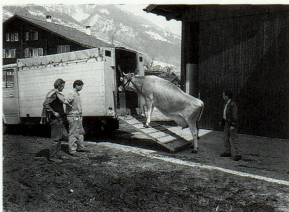
Ed alla fin, Dieus pertgiri, la capiergna ei ord nuegl, savens sin viadi ell'Italia ni tiel mazler. (Nunspetgadamein e bia memia baul).

nez ei vegnida sut squetsch, ferton che la fiera per biestga da maz ha priu tier grondamein el Grischun. Daco quella midada? Las ragischs ein d'anflar ella contingentaziun da latg. D'ina vart dattan las vaccas adina dapli latg e da l'autra vart ei il quantum latg fixaus per mintga bein puril. La limita ei absoluta e tgi che survarga ella vegn castigiaus. Per consequenza drovan ils purs ella bassa, quels che cumpravan las genetschas tratgas si ella muntogna, adina meins biestga da nez. La damonda per biestga da nez ei el decuors dils onns vargai adina vegnida pli pintga.