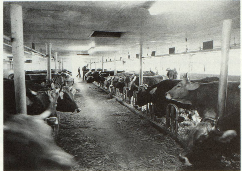
L'America vul paucs purs gronds che produceschan bia e cuostan pauc. Sch'il pur da muntogna sto semiserar sil marcau mundial cul pur American, lu va ei buca ditg pli.

Sche la spertadad crescha, sminuescha il spazi. La Svizra ei in pign spazi beinstont. Sch'il mund rotescha pli e pli spert, perda la Svizra siu beinstar e sia situaziun extraordinaria.