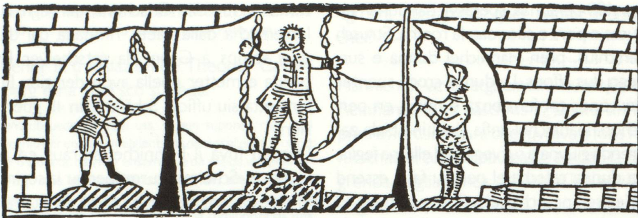
Hannichel en perschun a Sargans

ora. Mo il pauper schani resta pendius cun omisdus combas ella seiv.