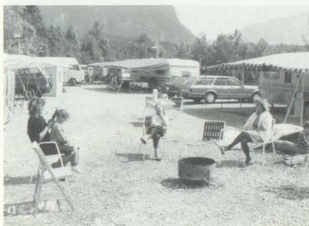
Plaz per las rulottas dils Jenischs. Enzennas positivas. Bonaduz 1989.

Uss, vegn, trenta, gie tschunconta onns pli tard, han ils pertuccai finalmeins la pusseiv-ladad da s'occupar dil vargau. La separa-ziun dils geniturs e fargliuns ha caschunau grevas plagas. Biars anteriurs affons dall'acziun «affons dalla via» ein turmentai da temas, depressiuns ed auters pro-blems psichics. Aunc uss s'entaupan far-gliuns e parents ord differentas famiglias separadas per l'emprema gada. Quei se-veser ei cumpigliaus cun plascher mo era cun profundas emoziuns. «Quei ch'ei ve-gniu destruiu en nos'affonza san ins buca pli reparar, silpli mitigar», gi Heinz Kolleg-ger.