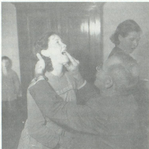
Dr. Siegfried interquera affons jenischs ch'el ha mess sut ugardia. Ca 1950

dall'ovra «affons dalla via», ina partiziun che fageva part alla fundaziun Pro Juventute.