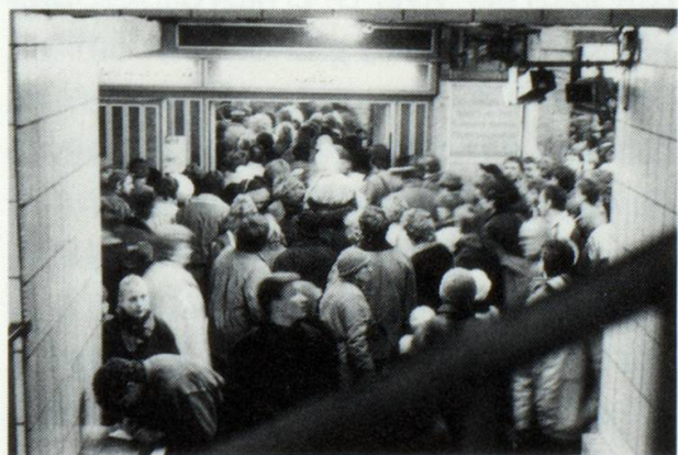
Berlin vest, ils 2 da december 1989

Ferton che nus havein tut en abundanza mauncan cheu las caussas pli banalas da