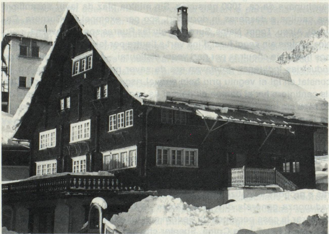
La veglia casa parvenda a Sedrun. Suten la stizun dil Consum liber

il plaun-terren cun aunc engrondir il sulom engiu ha ei dau in stupent local da stizun cun ina grondezia da ca. 120 m 2 , dasperas in biro ed autras localitads. La casa sco tala ei restada sco ella fuvava. Il local da stizun ei puspei vegnius renovaus 1955. Damai che la casa suren fuvava empau en decadenza eis ei vegniu concludiu 1968 da disfar ella totalmein e baghegiar ina nova tenor ils plans dils architects Robert Decurtins ed Albert Dettling. Il sulom ei puspei vegnius engrondius ensi, aschia ch'il local da stizun ha survegniu in volumen da ca. 200 m 2 , tut bein endrizzau alla moda moderna, cun ils necessaris magasins, maschinas e suren aunc 3 habitaziuns. Ils 19 da november 1969 fuvava tut preparau ed ins ha saviu arver la stizun nova, nua che mintgin saveva ussa sesurvir sesez. Dalla casa sut via han ins saviu far bien diever duront il baghegiar. Suententer eis ella vegnida vendida