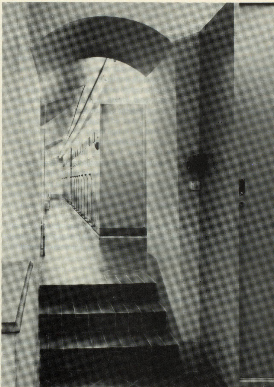
In sguard en in magazin di gl' Archiv dil stat. Quel cumpeglia 4 parts: A = archiv dallas Treis Ligias entochen 1798; B = archiv helvetic, 1798–1803; C = archiv cantunal dapi 1803; D = archiv da deposits.