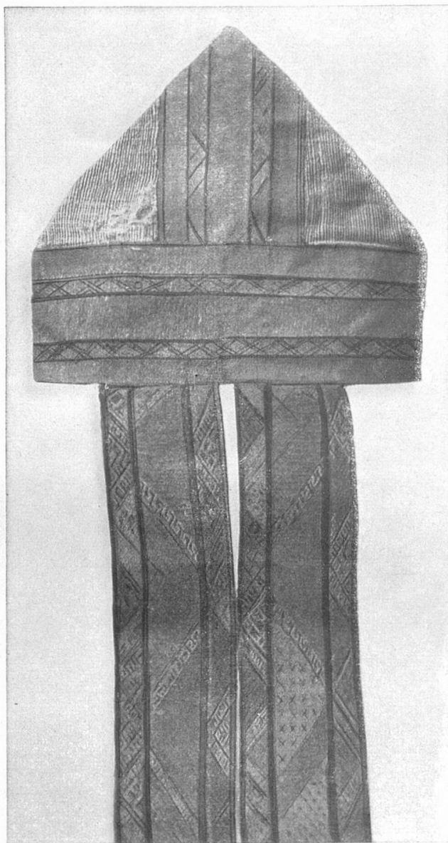
La gniefia de s. Sigisbert (14 avel tschentaner)