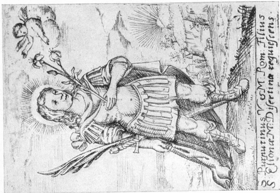
S. Purpurin Maletg de P. Adalgott Dürler 1671