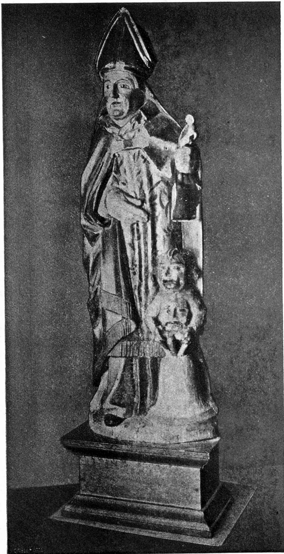
SOGN GIODER, statua gothica della claustra de Mustér.