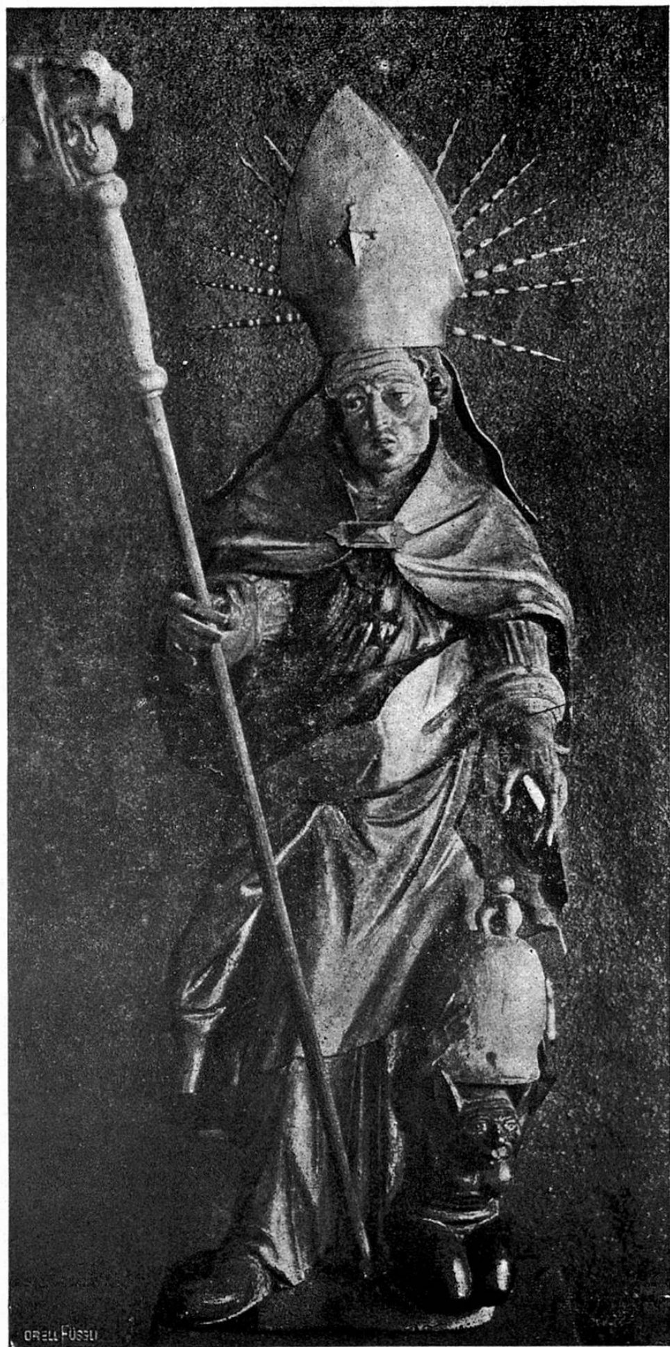
SOGN GIODER, statua digl altar grond della baselgia parochiala de Trun.