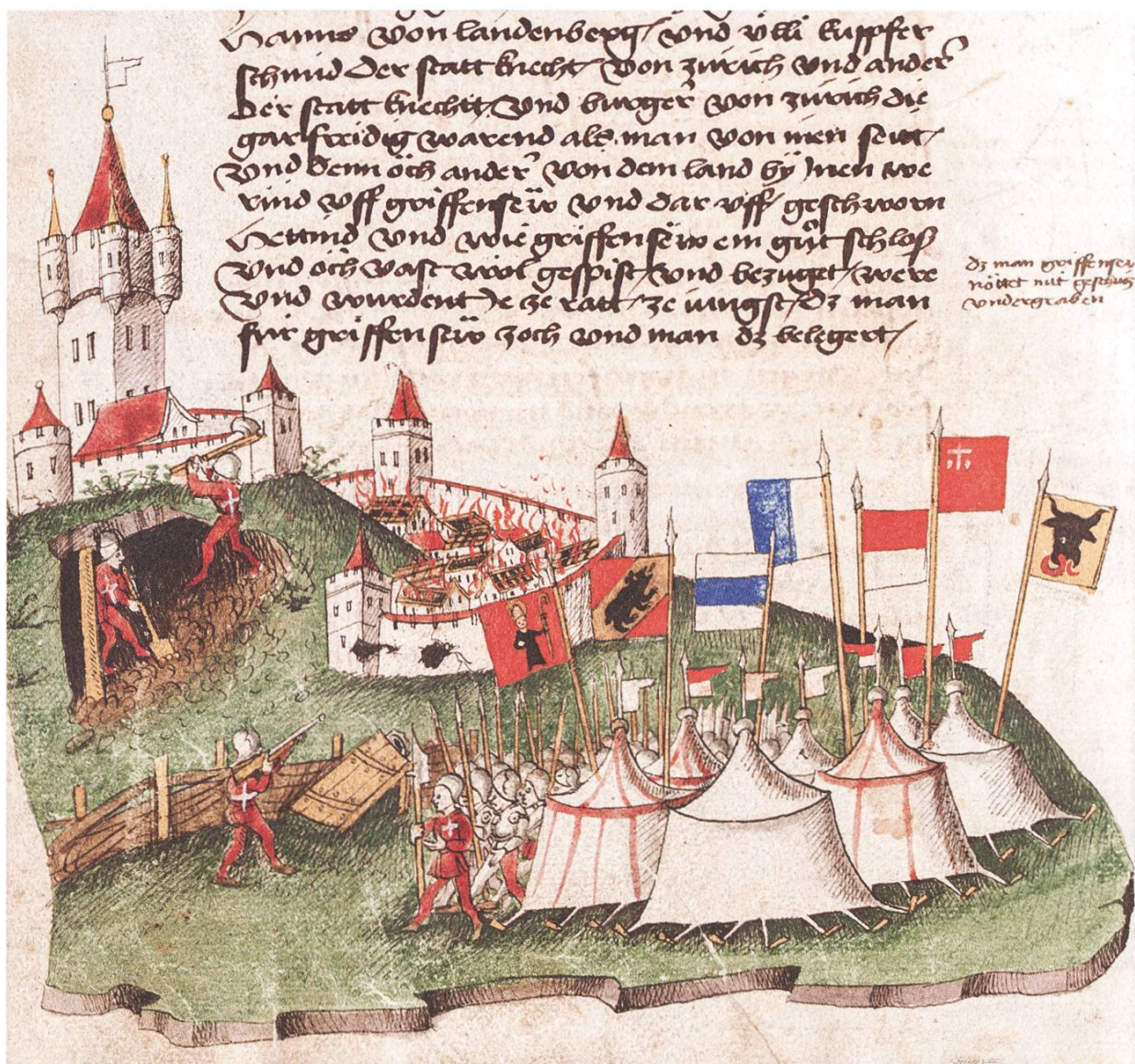
Belagerung des zür- cherischen Greifensee durch Innerschweizer Truppen im April/ Mai 1444 (Bluttat von Greifensee), links Unterminierung der Festung Greifensee. Bendicht Tschachtlan und Heinrich Dittlin- ger, Berner Chronik, Bern, um 1470. (Abb. 3)