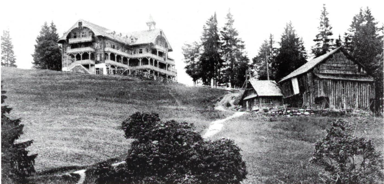
Alpenkurhaus Oberberg 1400 m ü. M. - Flums