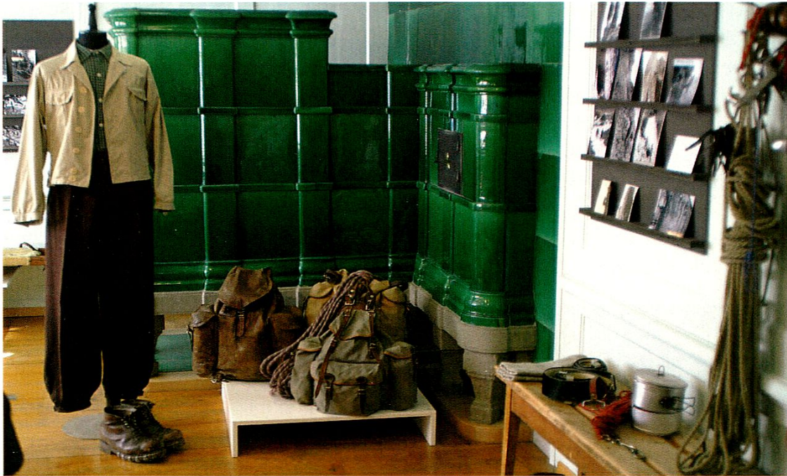
Blick in die Bergrettungs-Ausstellung.

Innerrhoder Bergrettung. Ein umfangreiches und sehr gut besuchtes Begleitprogramm mit Führungen, Vorträgen und Filmen wurde ergänzt durch die monatlichen öffentlichen Übungen der Rettungskolonne Appenzell.