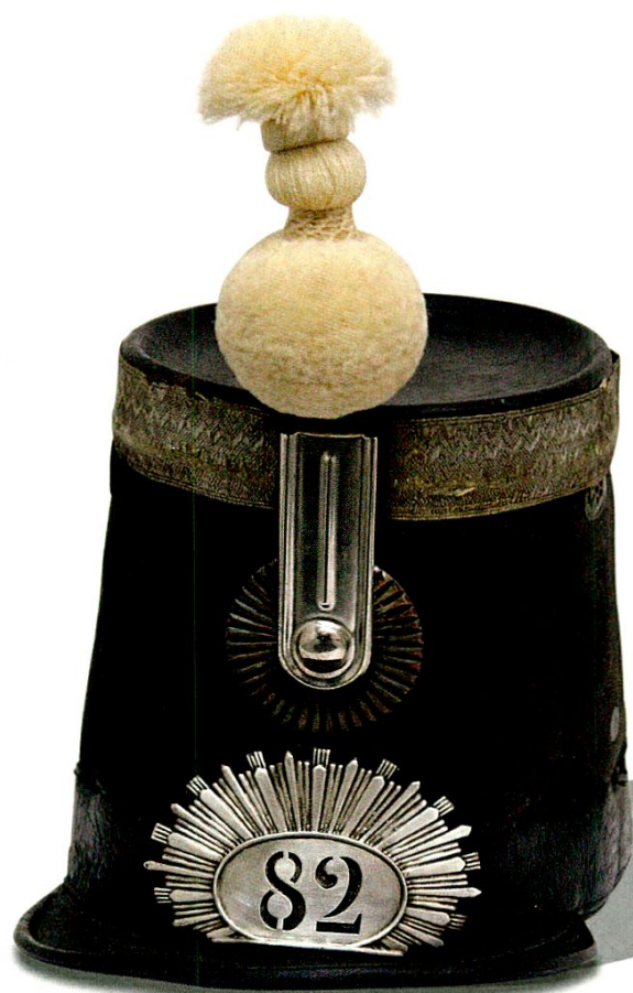
«Zigerstock»-Tschako für einen Offizier des Innerrhoder Halbbataillons 82, ab 1852 eidgenössische Ordonnanz.