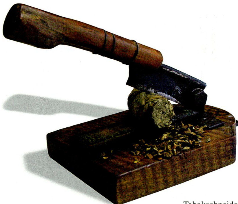
Tabakschneider mit Rolltabak.

Gemäss dem zweiten Dokument umfasst die Bestellung 700 \text{ⴒ} oder umgerechnet ca. 370 kg Holländer Tabak erster und zweiter Qualität, nämlich 400 \text{ⴒ} bester Sorte und 300 \text{ⴒ} zweiter Sorte, 100 \text{ⴒ} zu je 53 respektive 37 Gulden. 6