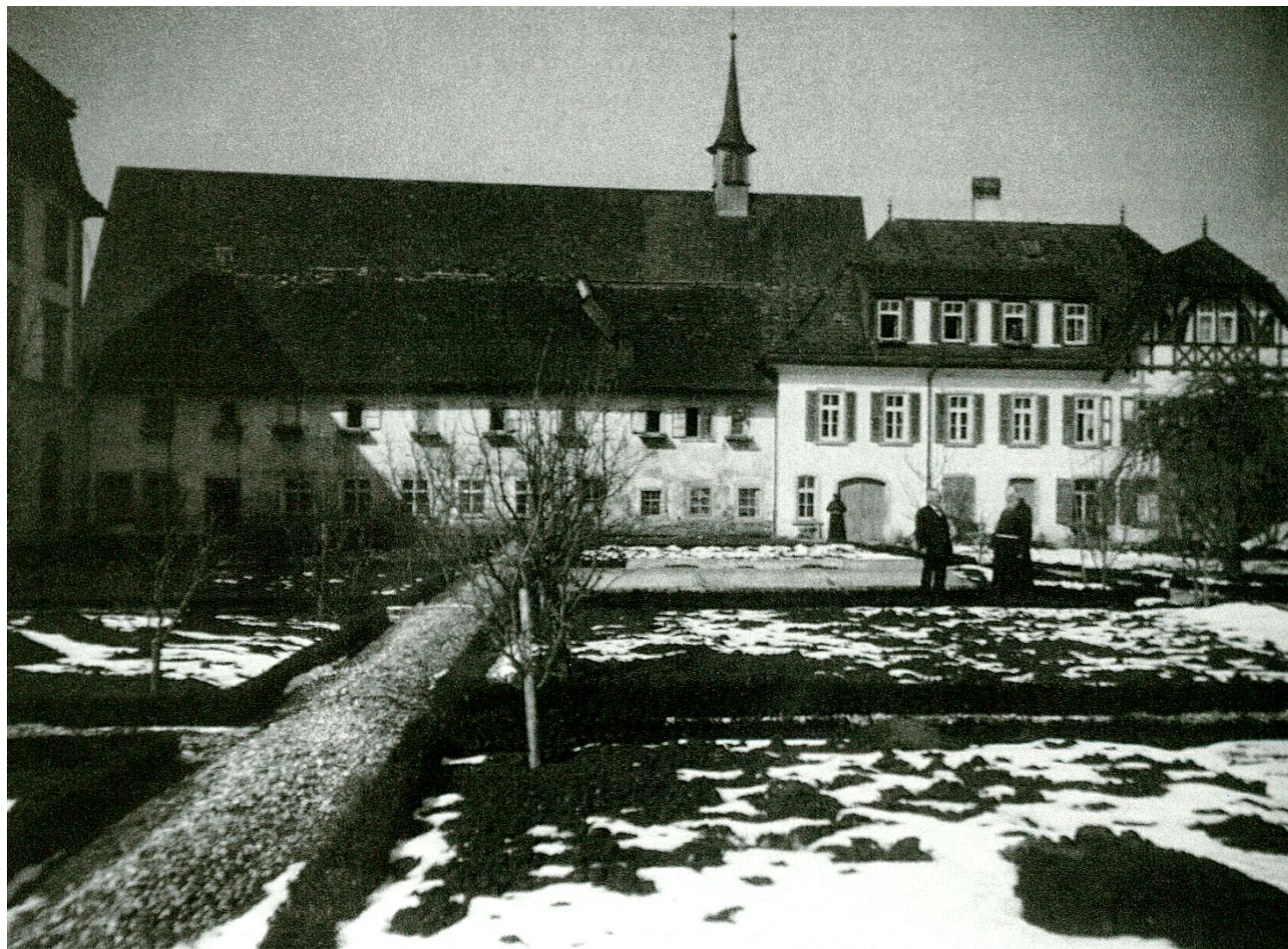
Noch liegt etwas Schnee im Kapuzinergarten von Appenzell. Nach 1906, vor 1925.