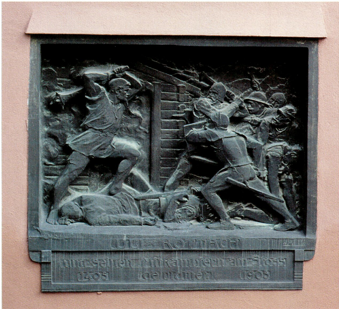
Das Uli Rotach-Denkmal an der Südfassade des Rathauses von Appenzell.

«Das Appenzeller Rathaus darf auf diesen Schmuck stolz sein, in seiner Verbindung mit der ganzen Architektur, der bei aller Kleinheit ungemein stattlich wirkenden Baues wirkt die Relieftafel durchaus monumental.»*