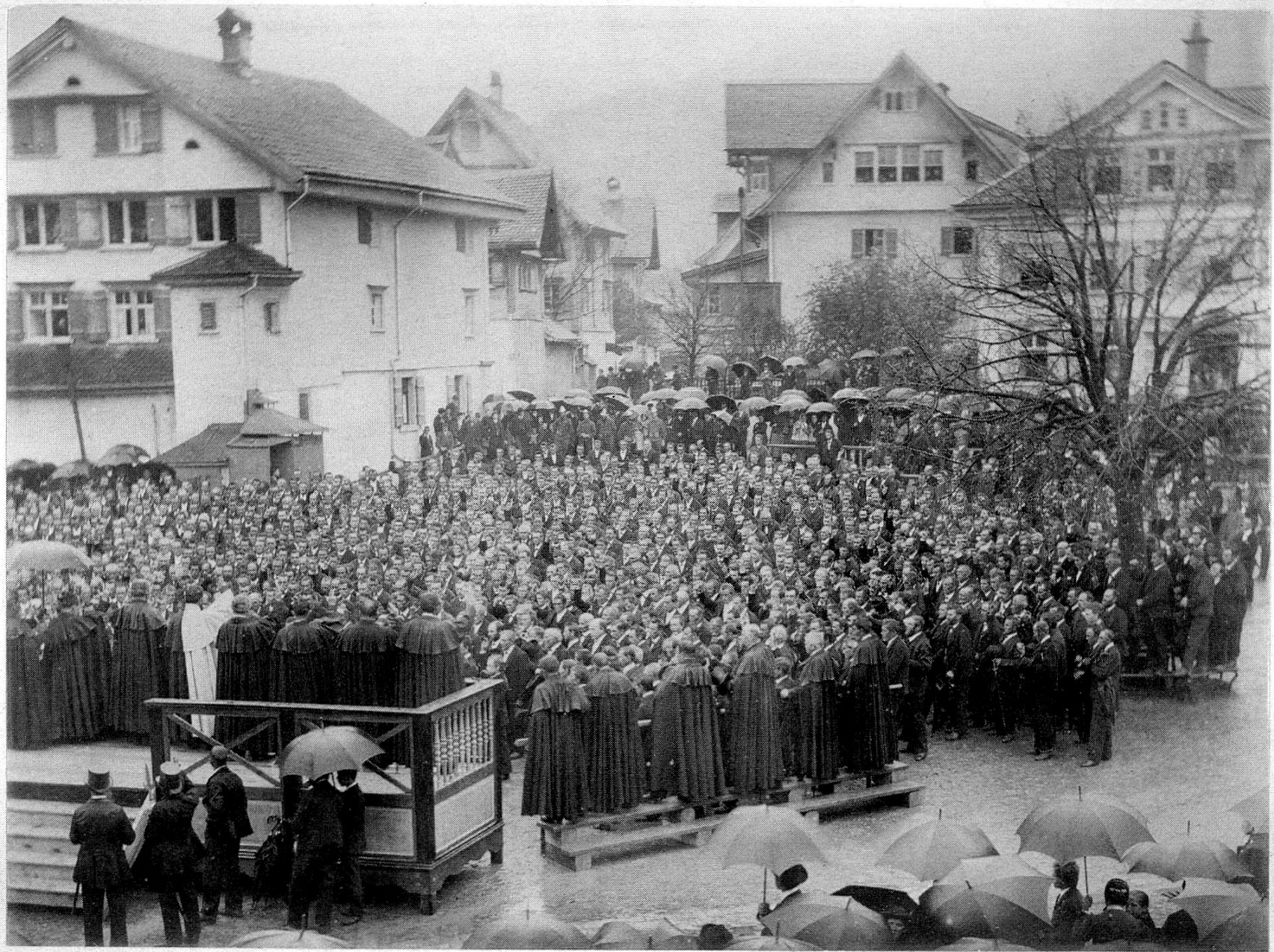
Collection du Prince Roland Bonaparte.