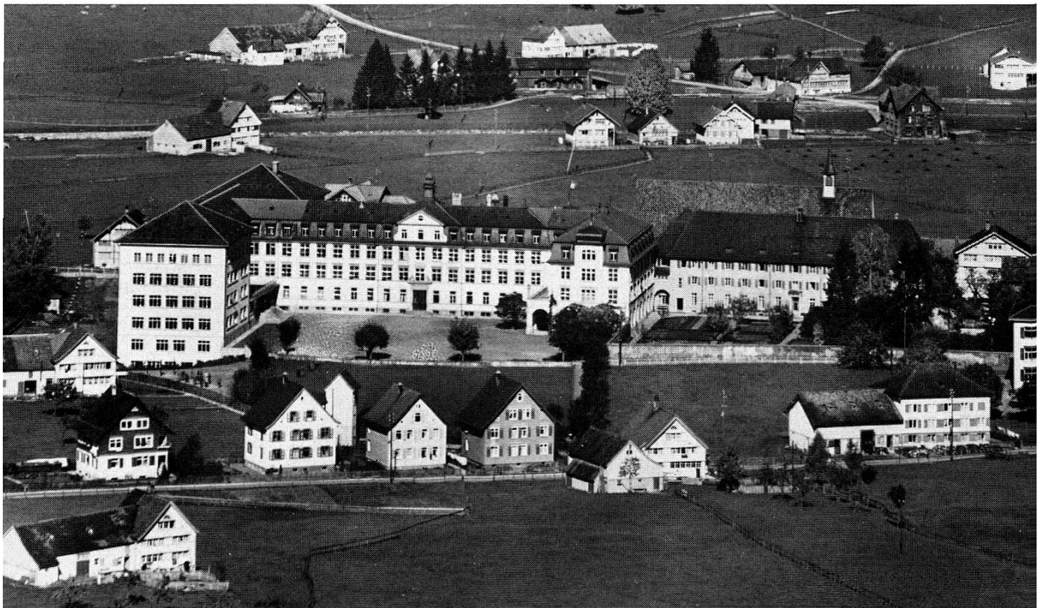
Kloster und Kollegium in den 40er und 50er Jahren.

Jahre 1905 die Initiative zum Bau eines Kollegiums in Verbindung mit den Patres des Klosters, um eine Mittelschule zu eröffnen. Nach längern und vorerst etwas harzigen Verhandlungen erreichte er, dass sich die Kapuzinerprovinz bereit erklärte, ein Internat und ein Externat für vier Gymnasial- und zwei, später drei Realklassen zu führen. Das Kollegium erhielt den Namen «St. Antonius» und wurde dem Abkommen vom 16. Oktober 1906 gemäss in den Jahren 1907/08 als Privatschule unter der Oberleitung und mit ausschliesslichem Aufsichtsrecht der Schweizerischen Kapuzinerprovinz am westlichen Rande des Dorfes erbaut. Anfangs Mai 1908 zogen die ersten 24 Appenzeller Schüler zum provisorischen Vorkurs in den noch unfertigen Bau ein, und schon am 7. Oktober eröffnete der Provinzial Pater Philibert Schwyter das erste Lehrjahr. Die Schule entwickelte sich sehr rasch, so dass ihr schon im Jahre 1910/11 das kurz zuvor erworbene Fabrikgebäude an der Gontenstrasse für den Unterricht bereit gestellt werden musste. Im Jahre 1914/15 wurde dem bisherigen Längsbau ein Ostflügel angegliedert und 1923 das Gymnasium auf sechs Klassen erweitert. Zwei Jahre später war es auch möglich, die Bauarbeiten für die heimelige Studentenkapelle zwischen dem Hauptbau und der frühern Fabrik zu