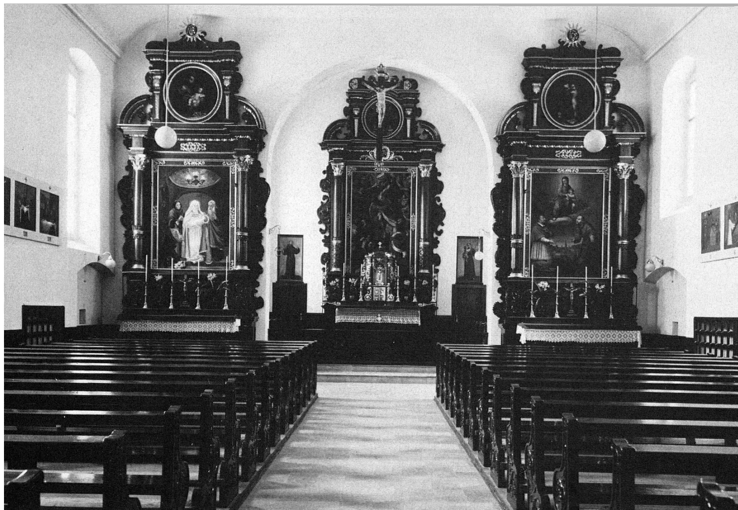
oben: Innenraum der Klosterkirche zwischen 1935 und 1974.