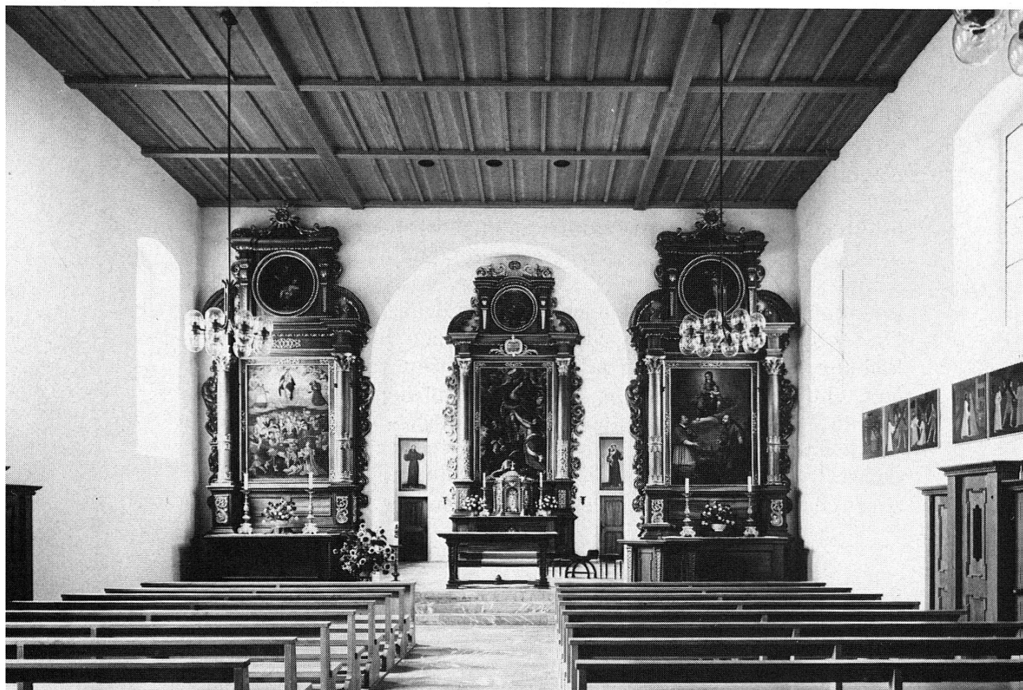
unten: Innenraum der Klosterkirche nach der Restaurierung 1974.