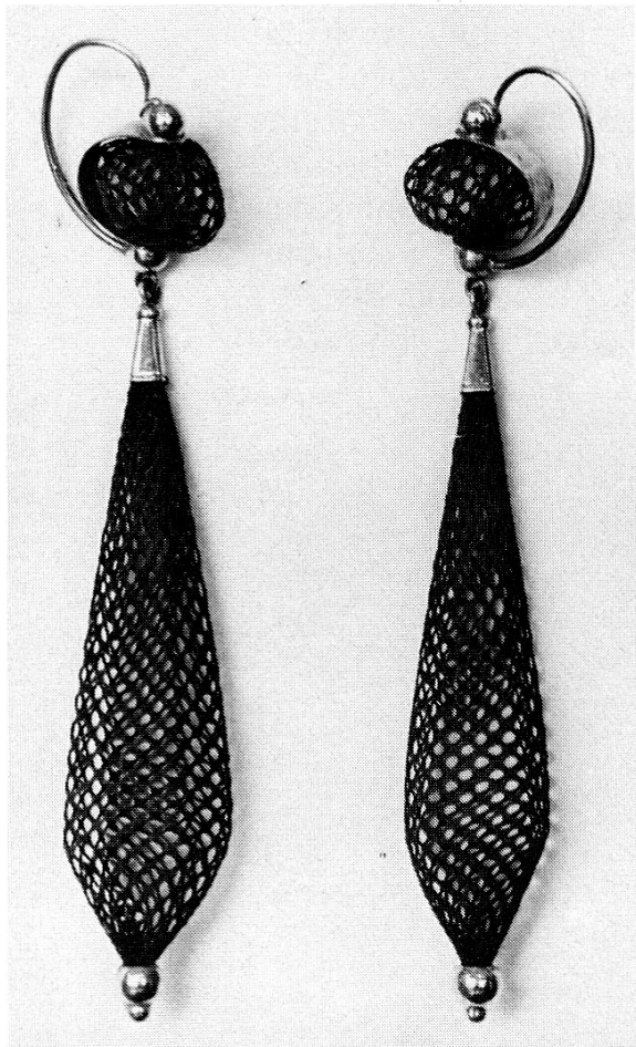
Haarbandglocken an Goldringen

bis 10 000 Personen, wobei die Schüler von einheimischen Klassen nicht genau gezählt wurden, da der Eintritt für sie gratis ist. Mit zehn Historischen Vereinen pflegten wir den Austausch der Jahresschriften, die unserer Kantonsbibliothek zugute kommen. Vergeblich baten